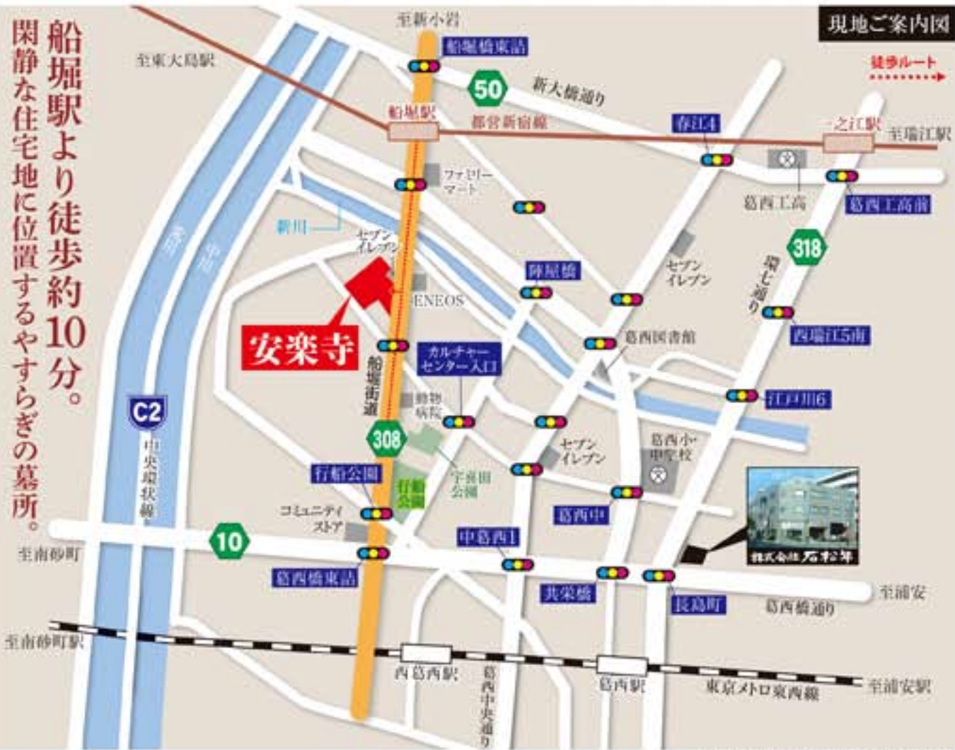
(所在地) 東京都江戸川区北葛西1-25-16