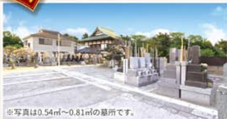
※写真は0.54㎡～0.81㎡の墓所です。

区画数限定の為、先着順受付となります。尚、お支払には建墓ローンがご利用いただけます。